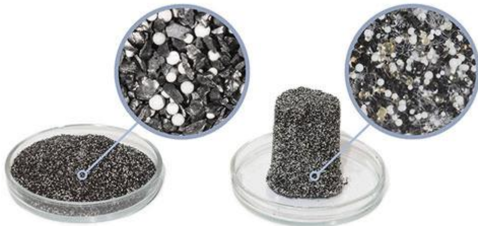
Aktivkohle Granulat herkömmlicher Filter

volgens vele experts is de Aquaphor K1-07 de meest populaire waterfilter. Thuis, in een caravan of op een boot. De kwaliteit, de filterprestatie, de goede smaak en het gebruiksgemak worden alom gewaardeerd. Omdat Aquaphor filters iets hebben wat andere koolstoffilters niet hebben: Aqualen®. Wij laten zien waarom wij denken dat dit waterfilter het beste op de markt is.